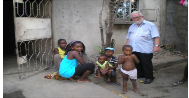
De visita aos seu protegidos

Obrigado, obrigado e mil vezes obrigado por nos dar a oportunidade e meios de ajudar.